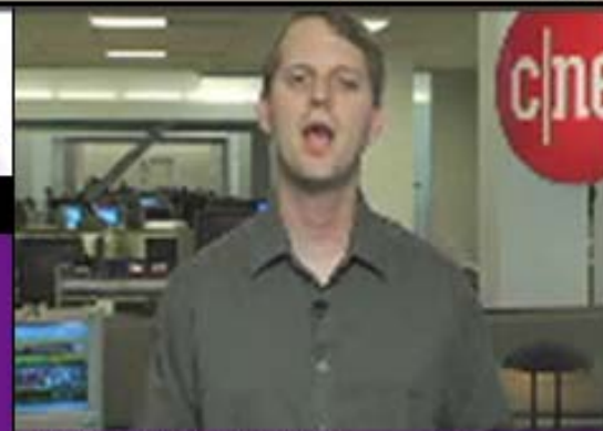
KNOW HOW 2: DE MIDDELEN

Biedt IT-managers en security professionals de mogelijkheid. Managers en security om kennis vergaren oh ja wat een rare tekst. Biedt security