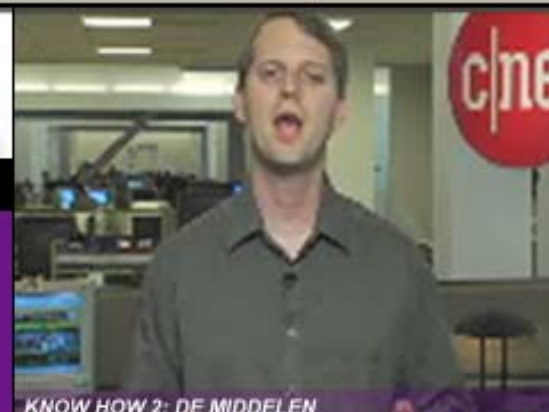
KNOW HOW 2: DE MIDDELEN

Het draait bij ICT om de strategische toepassing van technologie in alle bedrijfsprocessen. Organisaties die ICT duurzaam inzetten vanuit deze geïntegreerde benadering verbeteren daadwerkelijk hun concurrentiekracht. Hoe? Samen met Media Plaza vindt u de antwoorden.